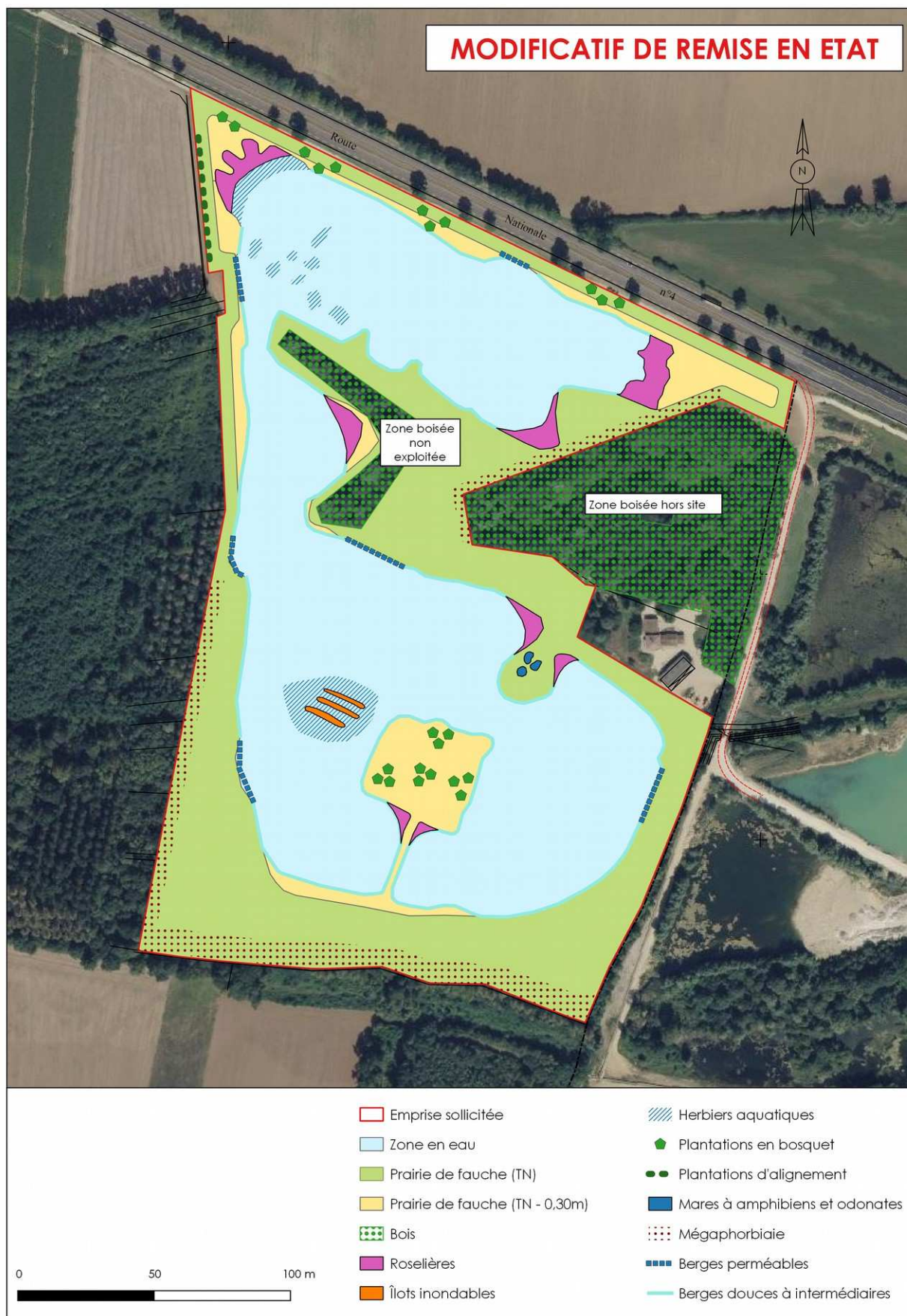
Illustration 2- Plan de remise en état modifié